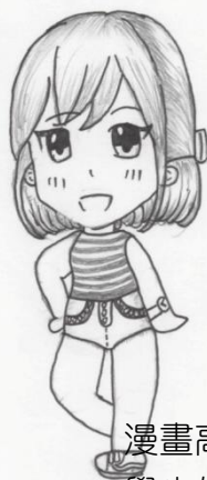
漫畫高手 學生作品