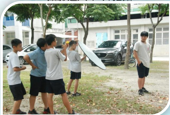
攝影達人 戶外拍攝